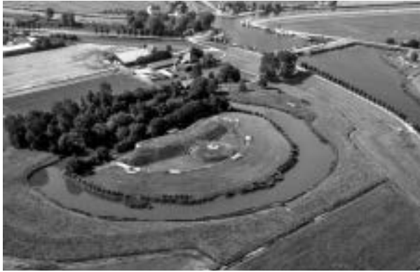
Luchtfoto van Fort bij Spijkerboor.

Intusschen wordt ons land hoe langer hoe meer 'n katje dat niet zonder handschoenen aan te pakken is, en dat sleept ons misschien overal zonder kleerscheuren doorheen.' Dit schreef hij op 12 februari 1915. Hieruit blijkt dat hij beseftte bij te dragen aan de afschrikking door gewapende neutraliteit. Dat ging echter gepaard met een groot sociaal effect op de militairen, de verhouding man-vrouw, hun gezinnen en de economie.