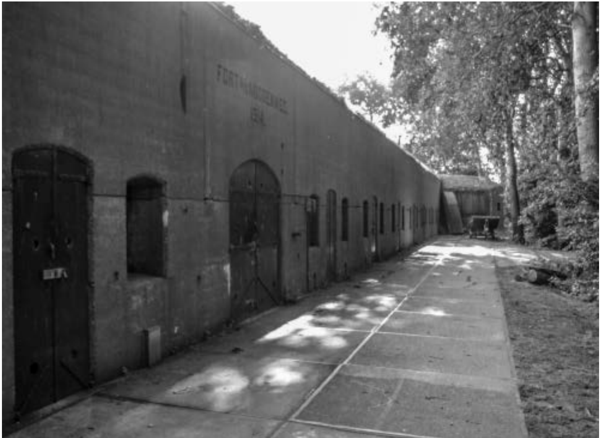
Keelzijde van de bomvrije kazerne van Fort aan de Middenweg.

wegen door die inundaties af te sluiten, werden daar forten gebouwd. Deze forten werden, in tegenstelling tot oudere forten in andere linies, klein gehouden door ze een beperkte artilleriefunctie te geven. De zware artillerie werd tussen de forten geplaatst.