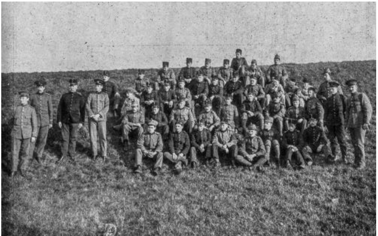
Een groepsfoto van een deel van de bezetting van Fort aan de Jisperweg. Herinneringsalbum 1916.