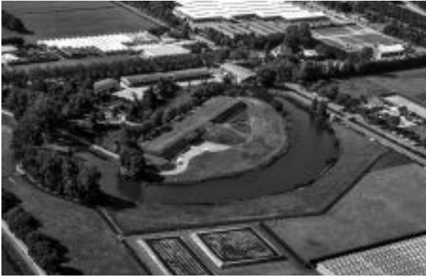
Luchtfoto van Fort benoorden Purmerend.

uit Utrecht en Zuid-Holland gaat het om 90%. De provincie van geboorte geeft meer variatie en dat komt omdat mensen om economische redenen richting Amsterdam trokken. Van de militairen is 70% in Noord-Holland geboren. In Friesland en Zuid-Holland telkens 8,2%.