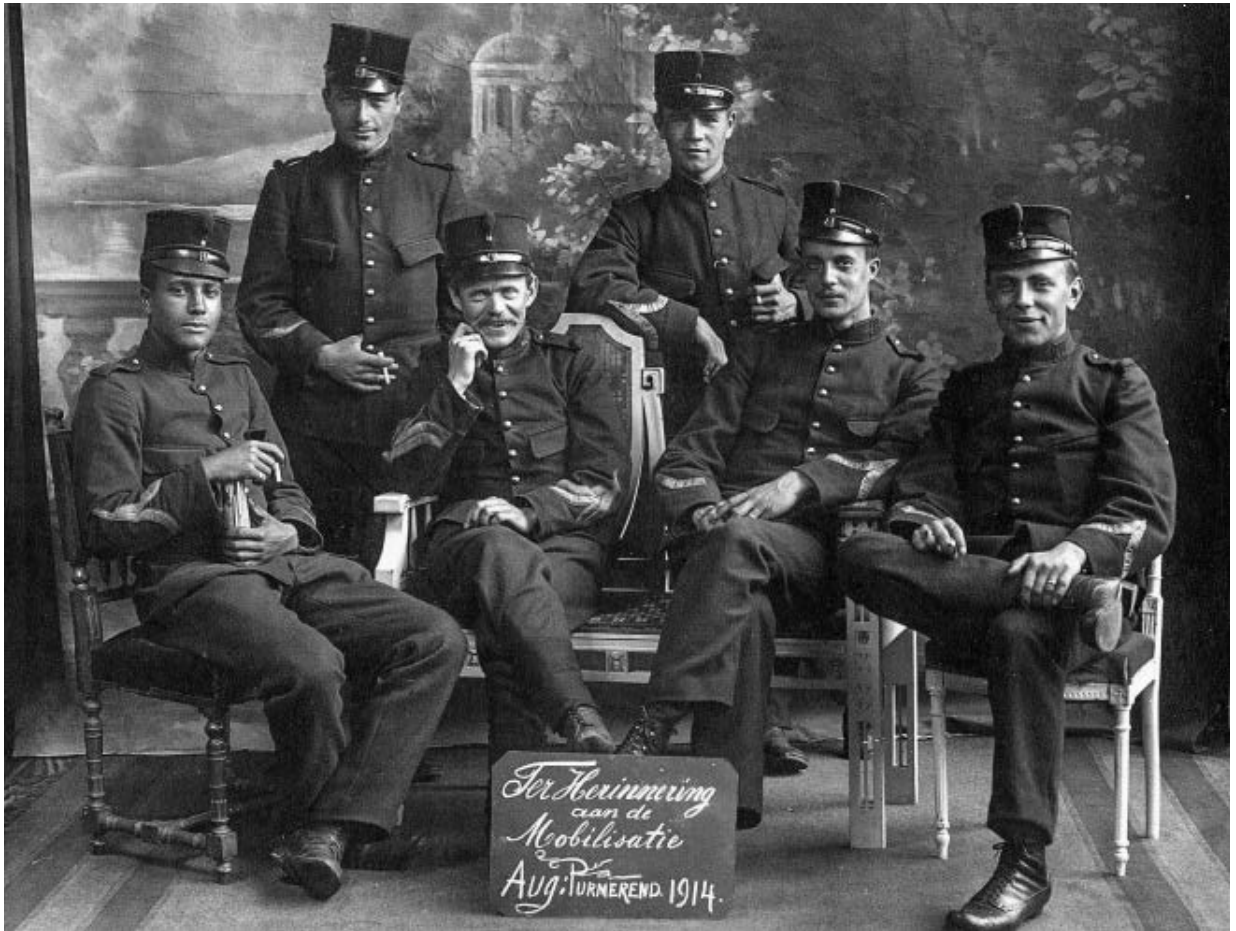
Groepsfoto van onderofficieren in Purmerend, 1914.